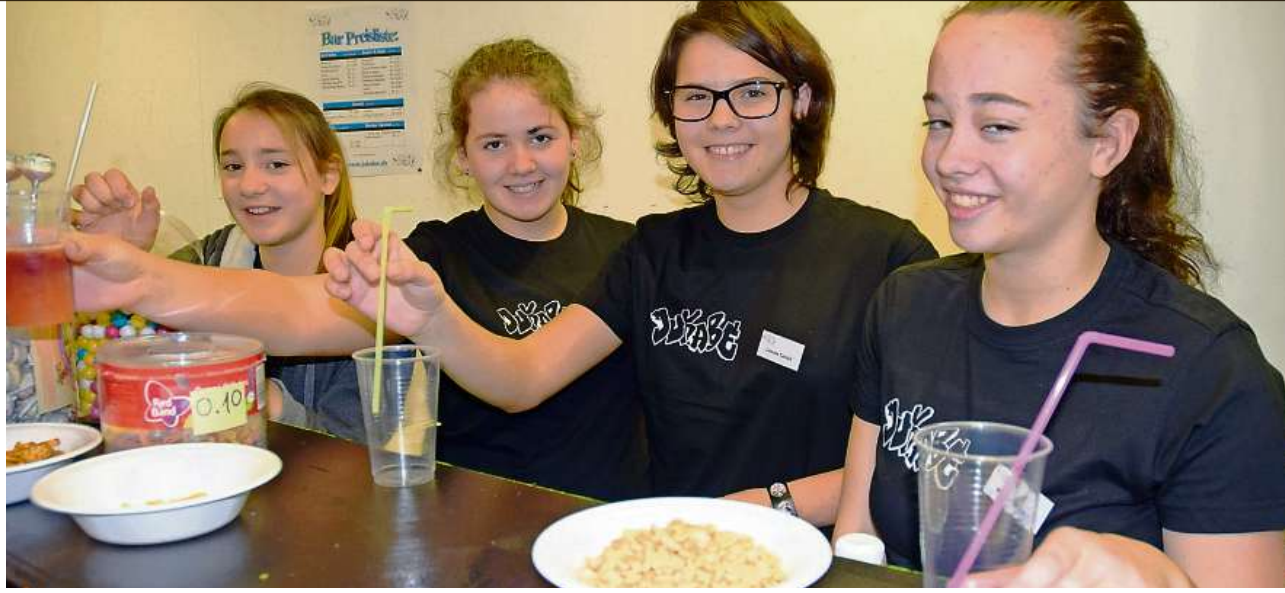
Mädchenpower: Girls just wanna have fun! Aufgestellt und voller Tatendrang bewirtschaften die Mädchen die Bar.

Selbst die Regeln der Hausordnung stammen aus der Feder der Mädchen und Jungen. Kreativ und «gschaffig» seien die Benkner und Kaltbrunner Jugendlichen, finden die Jugendarbeiter